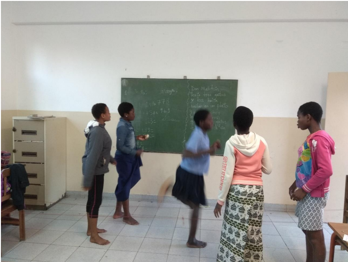
¡Cantando y saltando!