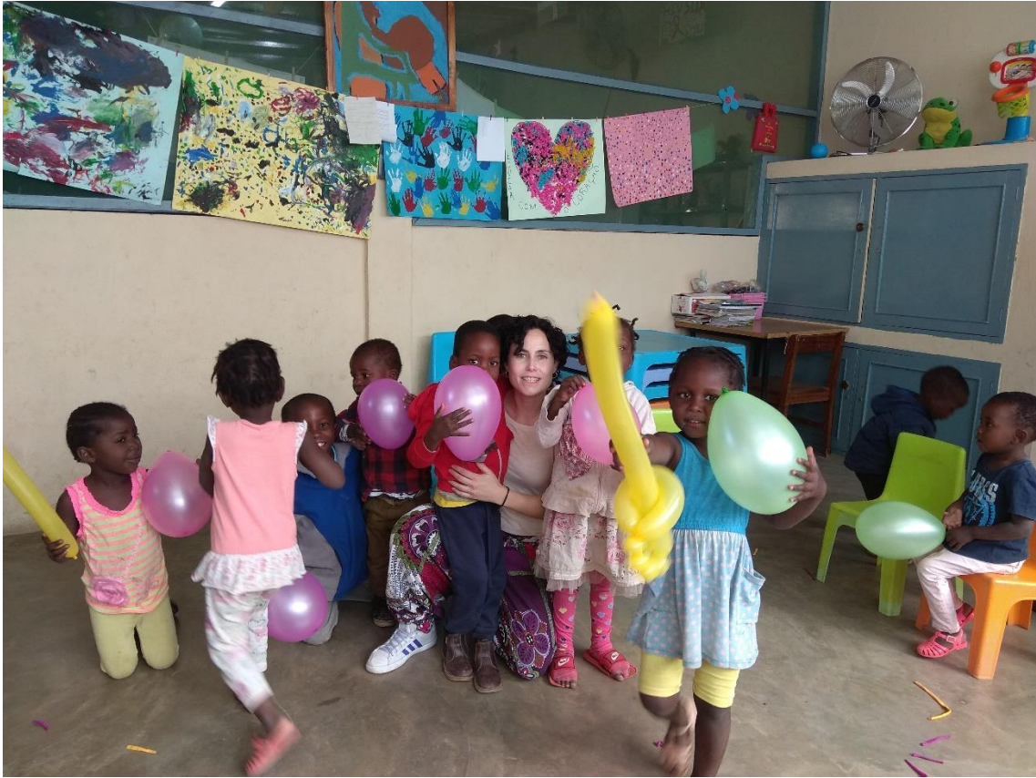
Globos para todas las niñas