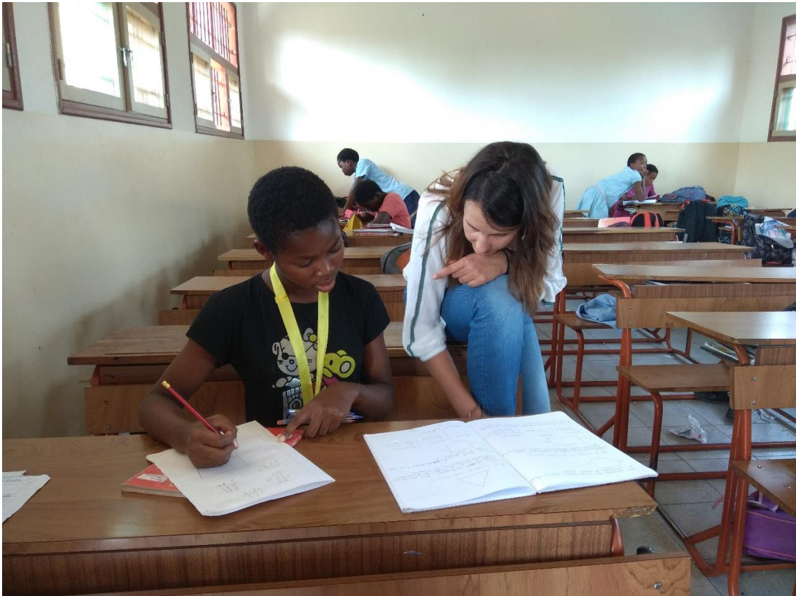
Ayudando en las tareas de la escuela