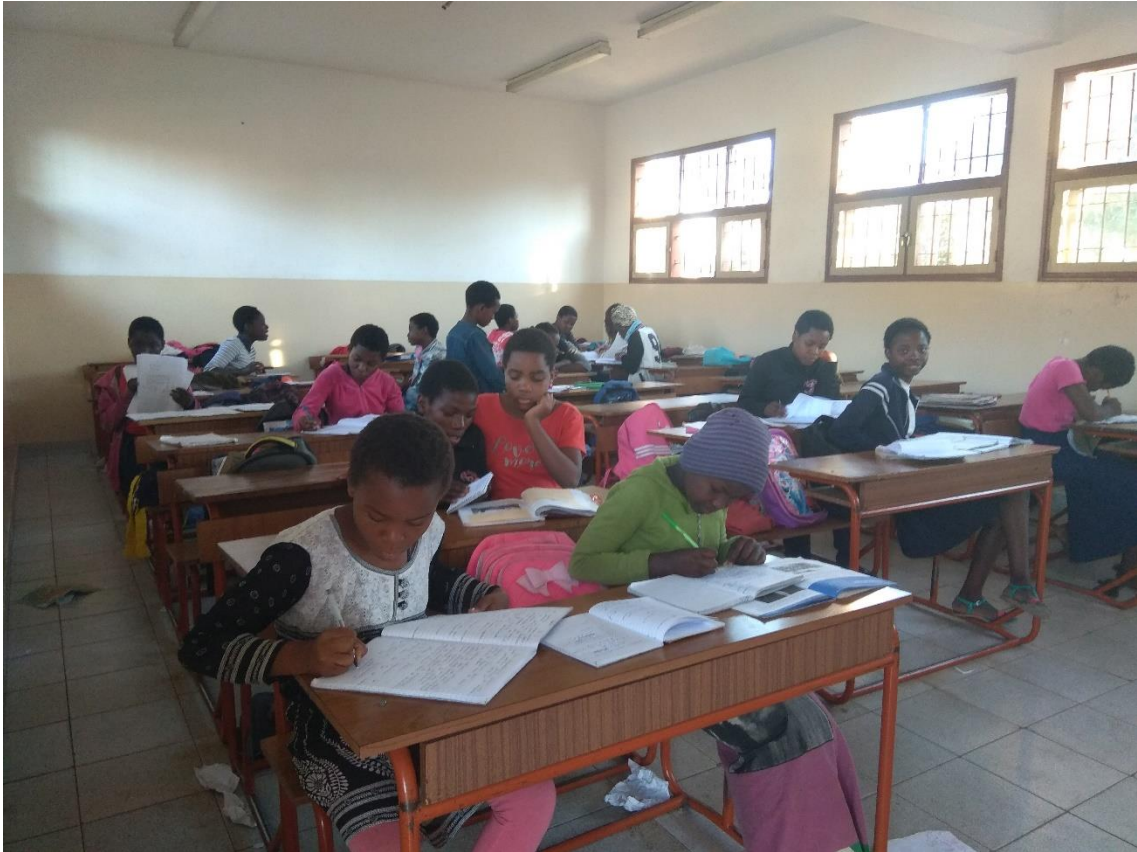
Aula donde estudian las niñas